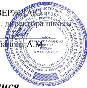
График посещения столовой учащимися МБОУ «СОШ а. Псаучье-Дахе имени Героя России О.М. Карданова» на 2022-2023 учебный год